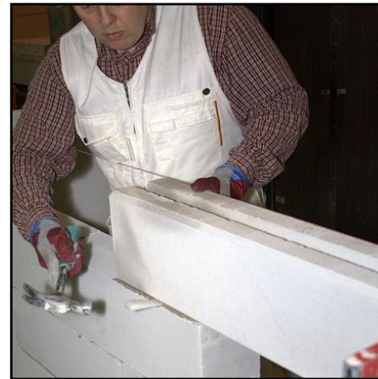
22. Lyö kiila yläpalkin saumaan.