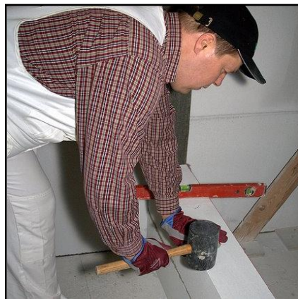
10. Asenna harkko linjalangan mukaisesti tiiviisti paikalleen kuminuijaa ja vesivaakaa apuna käyttäen.