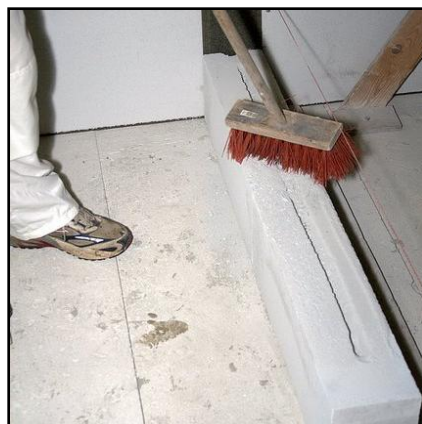
14. Puhdista ura jyrsiäjätteestä harjaamalla.