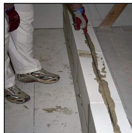
16. Paina kutistumateräset uraan. Terästen tulee jäädä kokonaan laastin sisään.