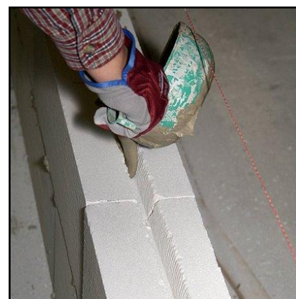
15. Täytä ura laastilla.