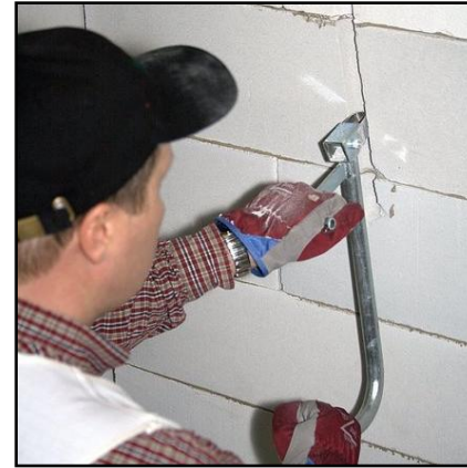
23. Tee tarvittavat putkiurat urakaapimella tai jyrsimellä. Palkkeja ja palkin tukipintoja ei saa urittaa.