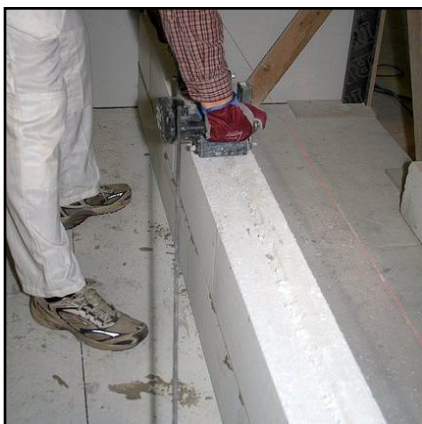
13. Suorita kutistumaterästen uran jyrsiä uranjyrsintäkoneella tai urakaapimella.