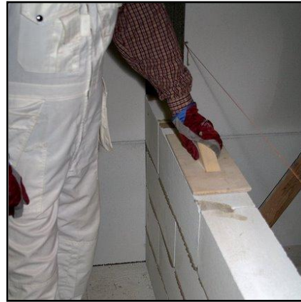
18. Tasoita epätasaisuudet hiomalla.