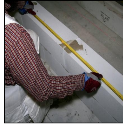
19. Aukon kohdalla mittaa harkkojen pituus.