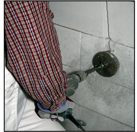
24. Tee tarvittavat rasiakolot rasiaporalla.