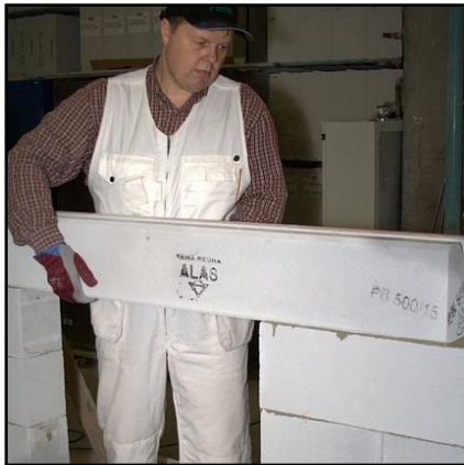
21. Asenna aukon yläpuolinen palkki paikoilleen.