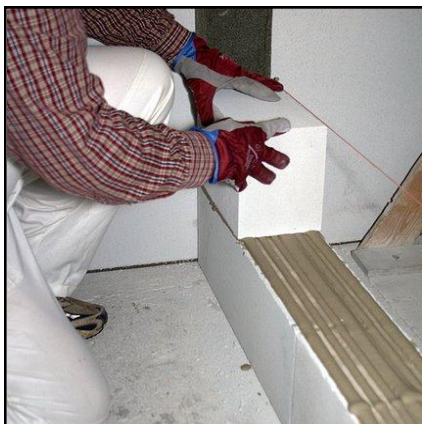
9. Asenna linjalanka toiselle riville ja lado harkot limittäin.