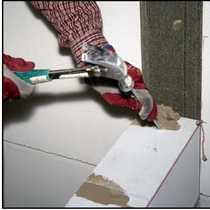
17. Lyö kantavien ja jäykistävien seinien liittyisiin ulkoseiniin alumiinipuikot joka toisen harkkosauaman kohdalle.