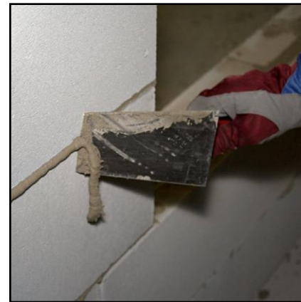
12. Poista ylimääräinen laasti saumoista kaapimalla.