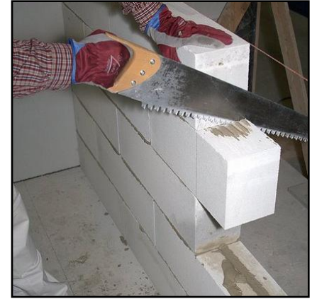
20. Sahaa ikkuna- ja oviaukot oikeaan mittaansa.